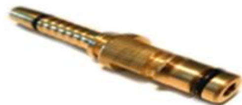
Armătură Kärcher pistol pentru aparate K5, K6, K7